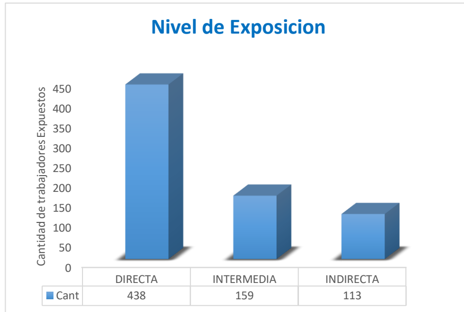
Grafico 1: Nivel de exposición de trabajadores.